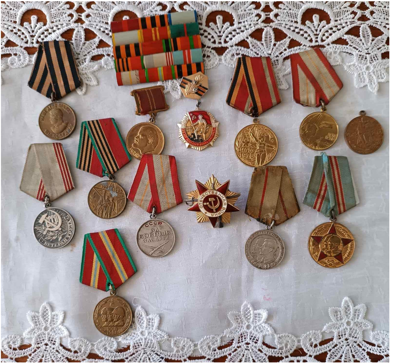
Узнагароды ветэрана Кірык.І.В.